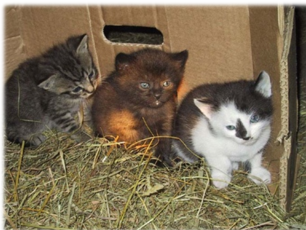
Tajenka je in

Tento příspěvek nám zaslala Irena Balcarová z Dobrušky, která se dlouhou dobu zabývá touto tematikou a chce přispět k tomu, aby se situace zlepšila.