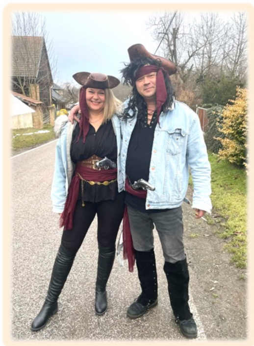
Foto z listopadového kvízu 2025.

28.3. si zopakujeme učivo ze školních lavic.